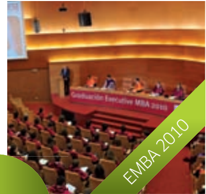
BARCELONA, 4 de mayo, 2010