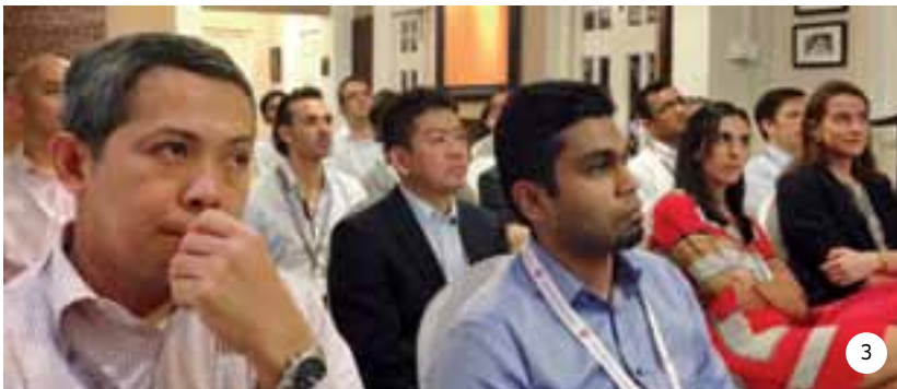
1. Schaffhausen 2. Londres 3. Singapur