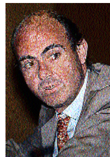
Luis de Guindos