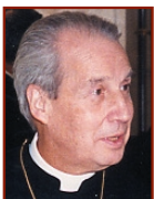
Monsieur Javier Echevarría Prelado del Opus Dei. Gran Canciller de la Universidad de Navarra.

Doy gracias a Dios porque este servicio, desde hace años, es una realidad; y no sólo en el IESE, sino en otras muchas instituciones similares de varias partes del mundo. Apoyados en el impulso espiritual y en el celo apostólico del beato Josemaría, han surgido en muchos otros países centros inspirados en el modo de hacer del IESE. Se ha demostrado y se demuestra una tarea muy necesaria en el actual contexto histórico, y lo será siempre. Porque también en este sector de la actividad profesional, los cristianos han de ser y comportarse como sal de la tierra y luz de mundo (cfr. Mt 5, 13-14).